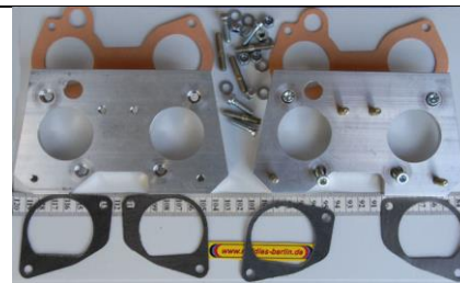
Luftfilter-Adapter Kit für Montage des Original-Luftfilter-Gehäuses aus Alu Kit d'adaptation pour le montage de la boîte d'air d'origine en alu

Kit komplett für Montage mit Original-Luftfilter-Gehäuse Fr. 2990.- Kit complet pour montage avec boîtier d'air d'origine frs 2990.- Kit komplett für Montage mit 2 K&N Sportfiltern Fr. 2850.- Kit complet pour montage avec 2 filtres haute performance K&N frs 2850.-